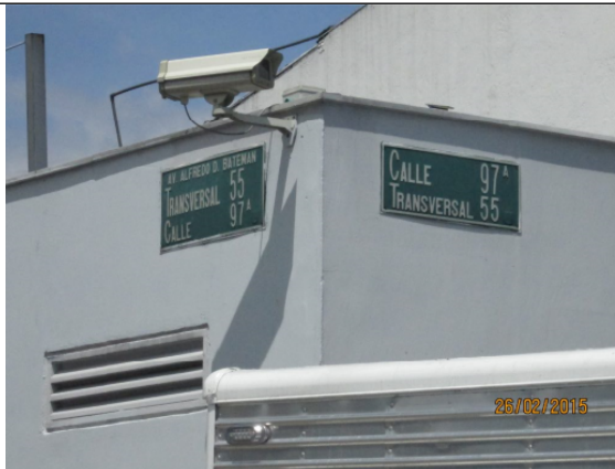
(TRANSVERSAL 55 No. 97 A - 36– Sitio original - Sentido Sur-Norte)