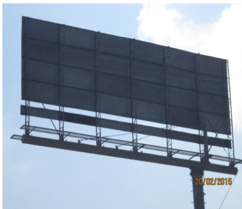
(AV. CALLE 17 No. 137 A - 81– Sitio de traslado - Sentido Oeste-Este)

VISTA DEL ELEMENTO DE PUBLICIDAD EXTERIOR VISUAL INSTALADO SENTIDO OESTE - ESTE: SIN PUBLICIDAD